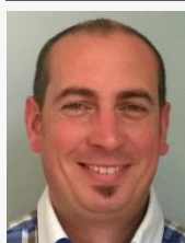
L'édito du président

Grâce à vous l'objectif des 150 licenciés a été atteint, c'est le résultat depuis plusieurs années de l'investissement des nombreux bénévoles et dirigeants du club.